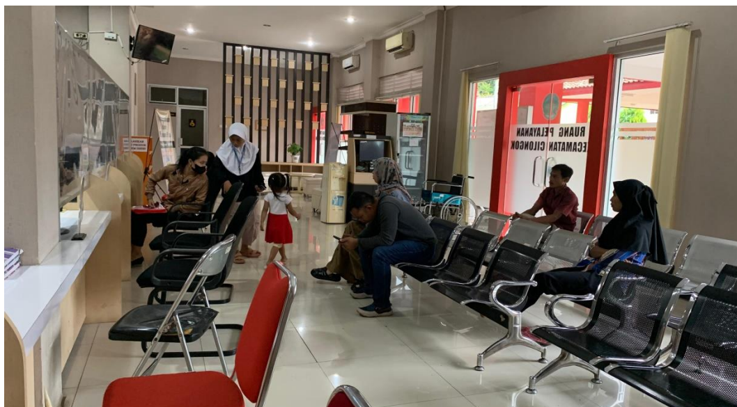
Gambar 2. Ruang Tunggu Pelayanan