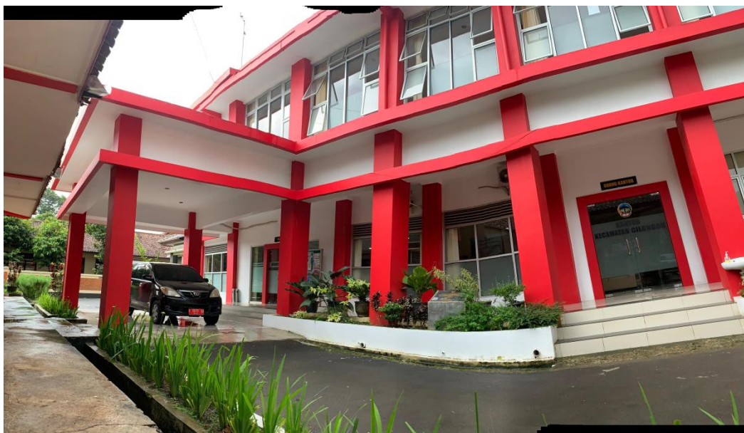
Gambar 4. Kantor Kecamatan Cilongok