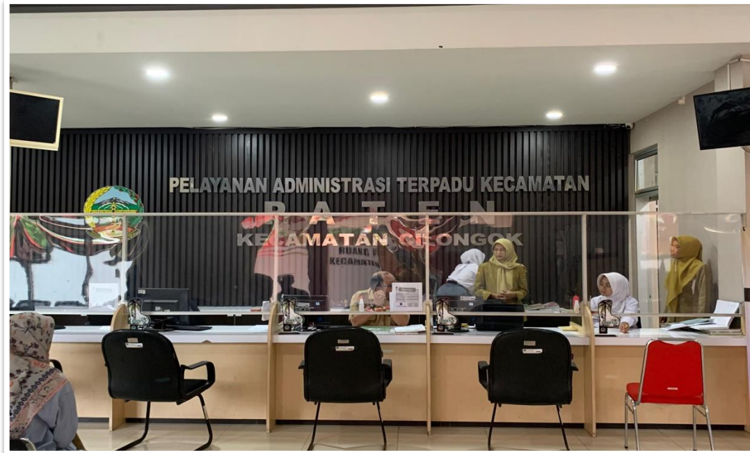
Gambar 1. Ruang Pelayanan