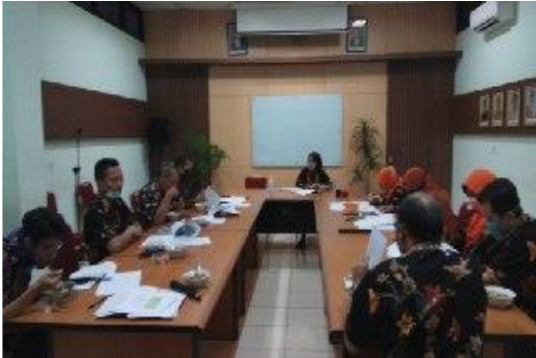
Rapat koordinasi manajemen membahas pembentukan tim Reformasi Birokrasi RSUD Ajibarang